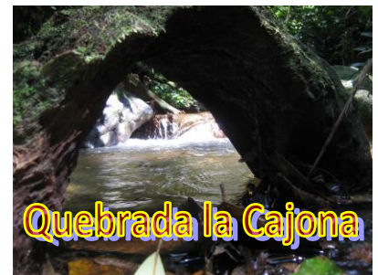
Quebrada la Cajona

Día 5.- Desayuno en el hotel. Con el equipaje a bordo, salida hacia el club campestre Villa del Rosario, un paraíso natural que nos permitirá disfrutar a manera de despedida de esta región de un corto baño en su piscina natural así como de sus instalaciones. Almuerzo típico. A la hora convenida iniciaremos nuestro regreso a Bogotá.