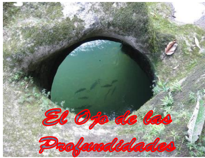
El Ojo de las Profundidades

Día 1º.- A la hora prevista iniciaremos nuestro recorrido con destino a Florencia.